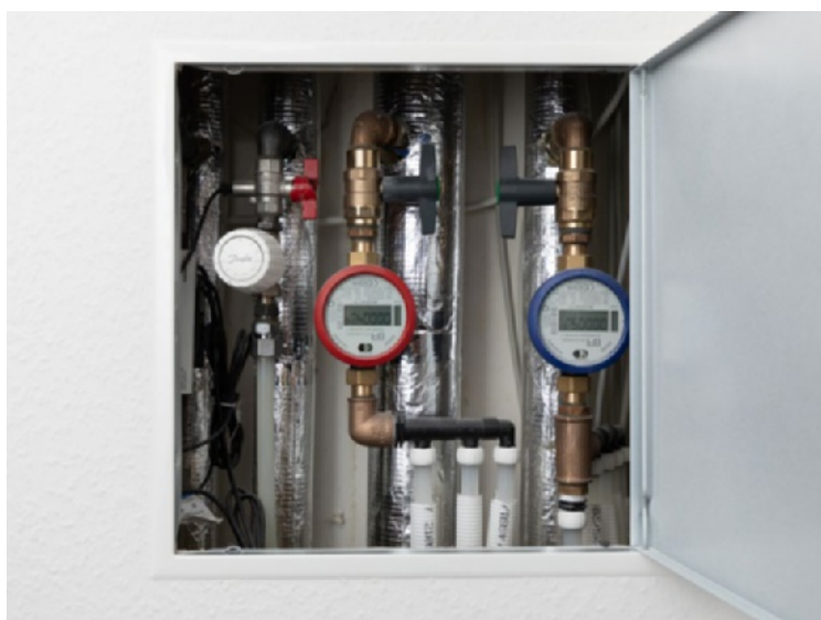
Som noget nyt er der i alle større lejligheder nu gulvvarme på badeværelset. Beboeren regulerer varmen via en termostat i lejlighedens teknikskab.

”Badeværelset trængte virkelig til en make-over, man kunne godt fornemme, at det var fra en anden tid. Det gamle badeværelse havde kun en radiator, så det var svært at opvarme, jeg