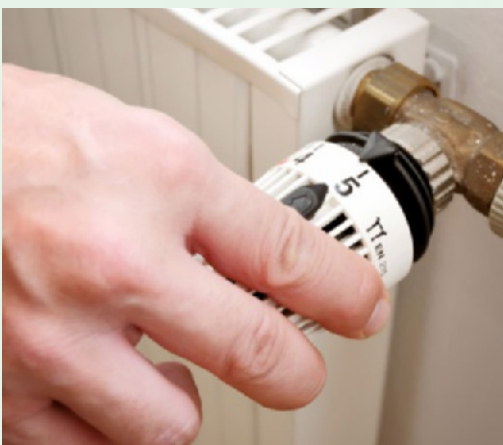
Tænk over hvordan du varmer din bolig op. Men hold det ikke for koldt.

Varmen i Aarhus kommer overvejende fra fjernvarme. Som du kan læse på modstående side, så er prisen på fjernvarme i Aarhus ikke steget. Desuden har du ikke indflydelse på den store del af din varmeregning, som går til abonnement.