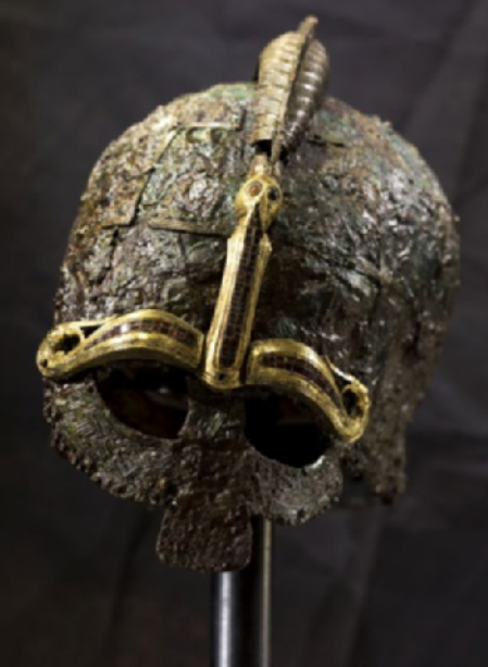
Krigerhjelme fra 500-tallet. Fundet i krigergravene i Valsgårde, Sverige.