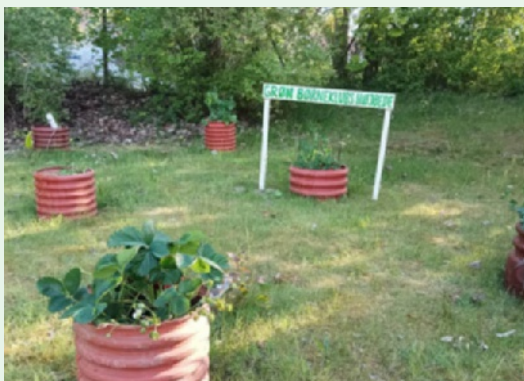
Gruppen har sat sit aftryk på Saralystparken med en pvc-rørs-have med blandt andet jordbærplanter.