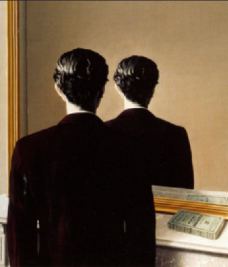
Oplev blandt andet René Magritte på ARoS.

Rundvisningen varer cirka en time. Vi har plads til 25 deltagere. Vi mødes ved billetsalget.