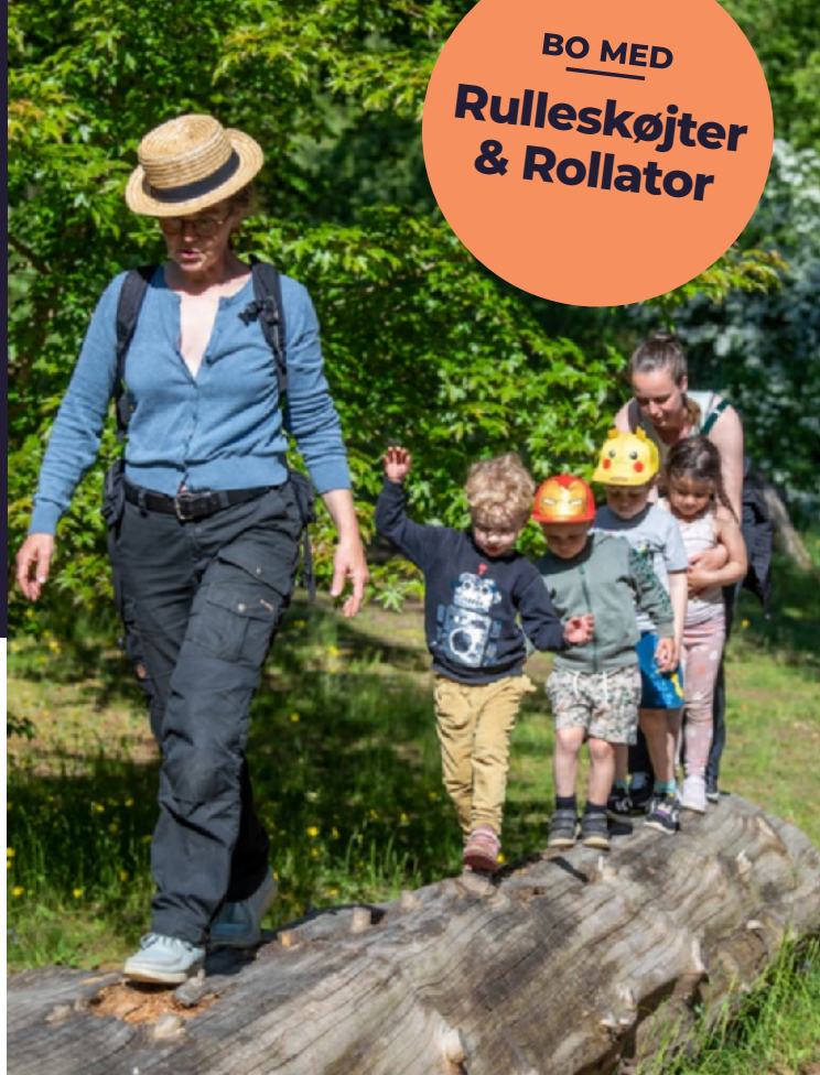
Grøn Børneklub arrangerer også ture ud i lokalområdet – her i Forstbotanisk Have.

i klubben. Aktiviteterne skaber en atmosfære, hvor børn og familier kan lege og lære sammen.