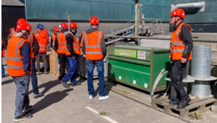
I alt 70 ejendomsfunktionærer har været gennem Kredsløbs kursus.

”Som boligforening med 80 års historie er ALBOAs ansvar ikke blot ejendomsforvaltning, men også – sammen med de andre knap 600.000 almene boliger i Danmark – at være en aktiv