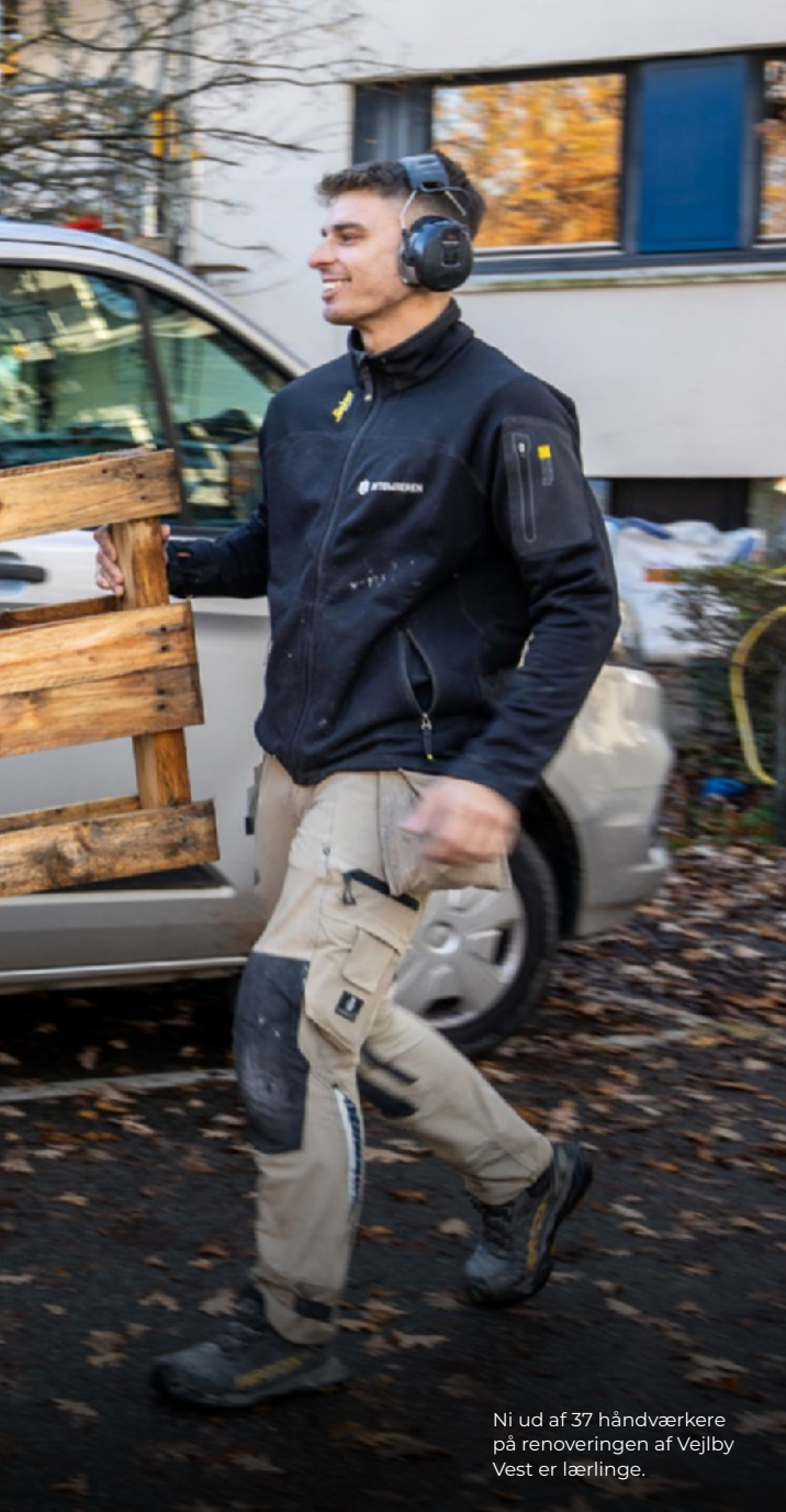
Ni ud af 37 håndværkere på renoveringen af Vejlbj Vest er lærlinge.