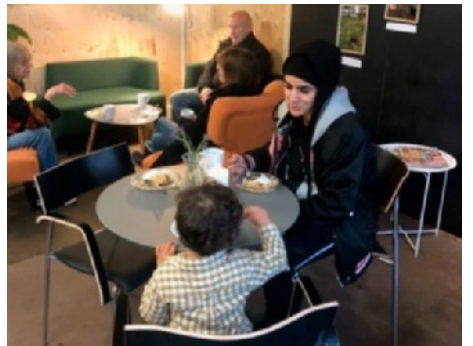
Café Samlingspunktet, torsdage kl. 9.30-12.00

Der er fokus på natur, og hvad vi kan oprette af levesteder også til andre arter end lige os mennesker. I Vejlbj Vest spirer grønne fællesskaber. Vi har Parkens Venner, Biodiversitetsgruppen, Bynaturgruppen, Spirerne ved Næ 32 og Havedyrkergruppen, som er godt på vej. Alle kan være med.