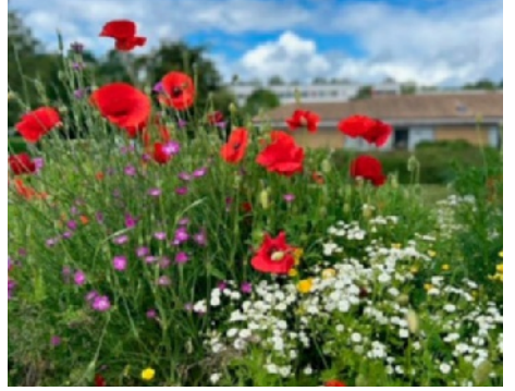
Biodiversitetsgruppen, mødes ved Samlingspunktet onsdage kl. 9.15-11.00

Huset er på kort tid blevet et samlingspunkt for en række aktiviteter i området, og beboerne er flittige brugere af huset – både i forbindelse med faste aktiviteter, men flere og flere beboere bruger huset som drop-in arbejds-/studieplads, eller som et pusterum for renoveringen i hjemmet. Her kan du læse om nogle af de mange aktiviteter, som finder sted i Samlingspunktet.